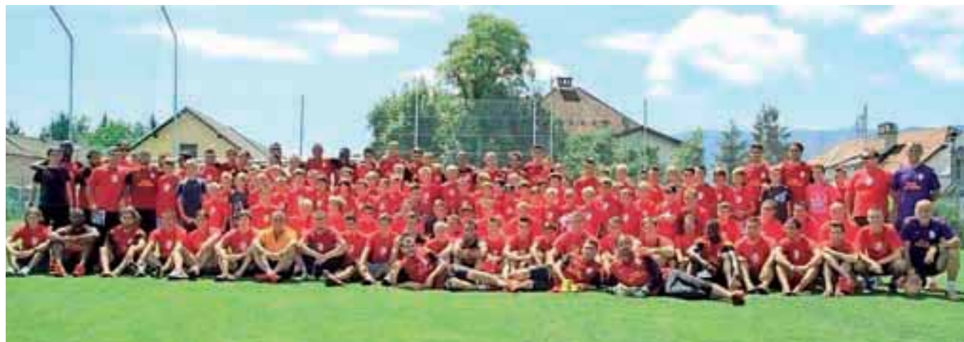
Galatasaray je omogočil tudi fotografiranje z otroki, člani Nogometnega kluba Šobec Lesce.