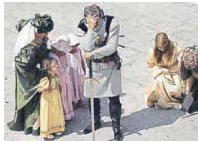
Fotografski natečaj Dogodki v občini Radovljica 2012: Exodus, avtor Janez Resman (diploma)