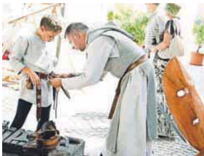
Mali in veliki vitez / FOTO: GORAZD KAVČIČ