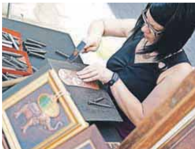
Predstavili so se tudi domači obrtniki