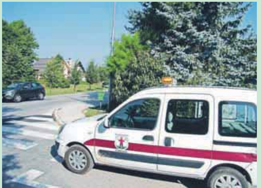
Neurejena živa meja, drevje (zmanjšano polje preglednosti)

cijo, ograje in druge ovire. Občinski inšpektorat in Občinsko redarstvo Občine Radovljica bo v primeru prijave zoper odgovorne uvedel postopek skladno z določili Zakona o inšpekcijskem postopku in Zakona o prekrških.