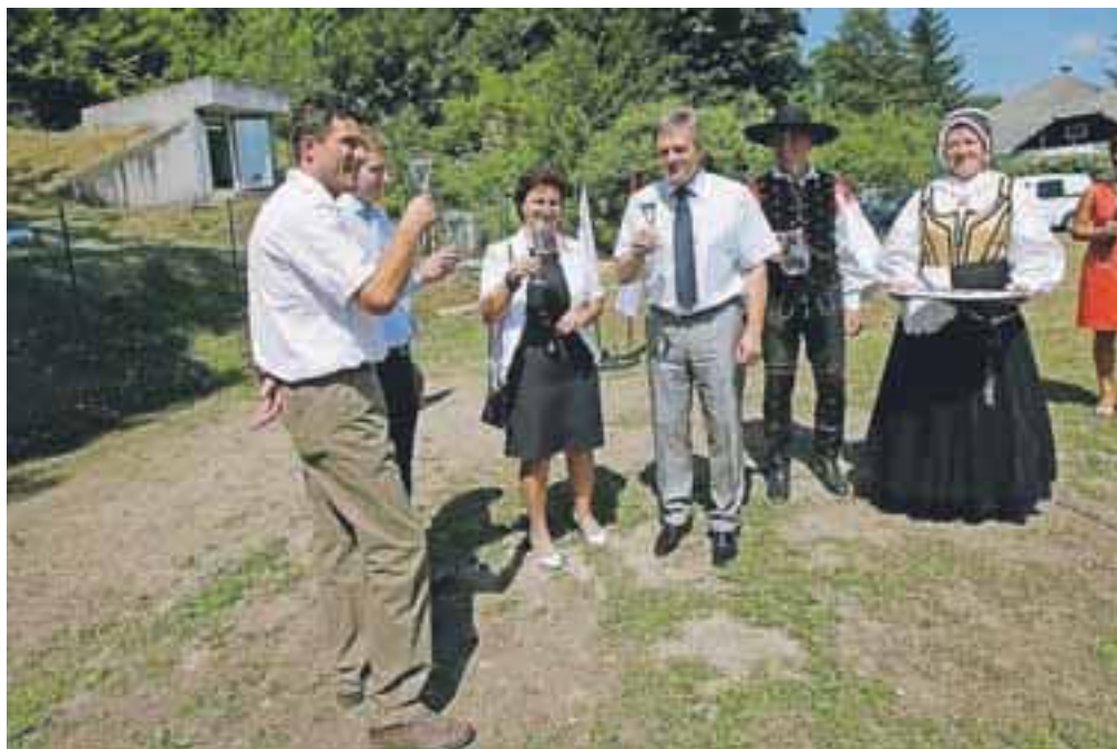
Nazdravili so s kozarcem sveže pitne vode iz novega vodovoda.