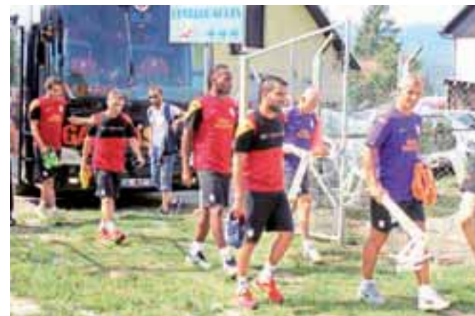
Nogometaši so se vsak dan dvakrat pripeljali s posebnim avtobusom z Bleda, kjer so bivali v hotelu Toplice.