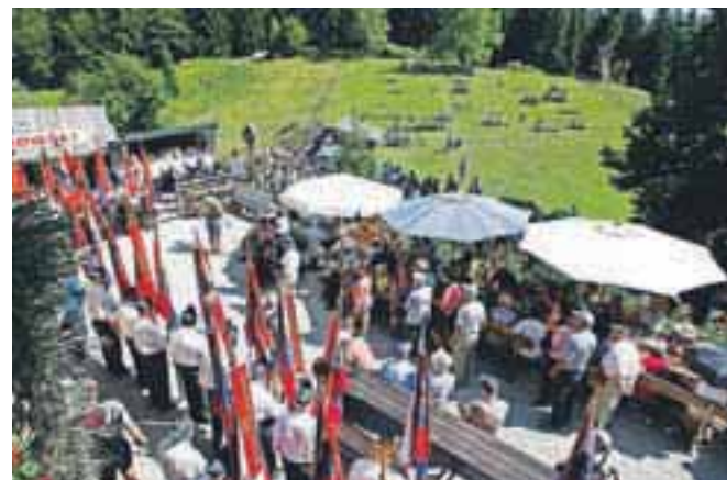
Kljub hudi vročini se je srečanja na Vodiški planini udeležilo skoraj tisoč ljudi.