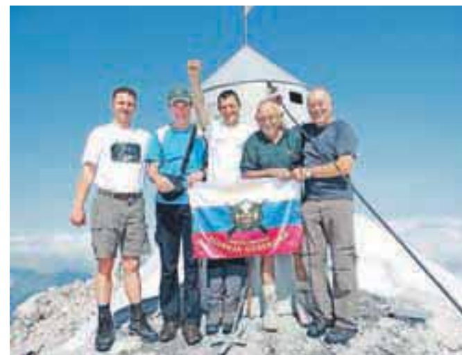
Pohodniki na vrhu Triglava

Ker je bila pot od Doliča proti vrhu zasnežena in meglena, smo se odločili, da se odpravimo do Planike in se tam odločimo, kako naprej. Ker smo bili na poti prvi, smo prek snežišč sledili