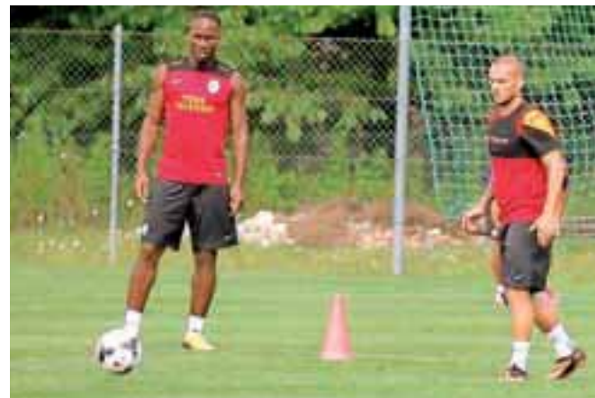
V Lescah sta trenirala tudi največja zvezdnika Didier Drogbja in Wesley Sneijder.