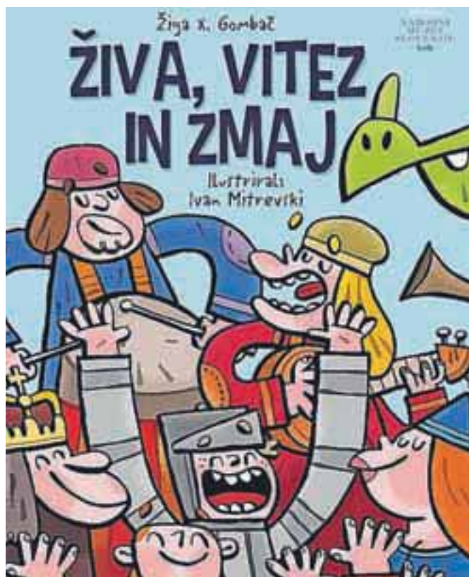
Živa, vitez in zmaj je druga knjiga, namenjena osnovnošolcem, iz zbirke Živa iz muzeja Žige X Gombača.

»Z Živo je tako, da ima zanimivo sposobnost. Ko se dotakne nekega predmeta, se znajde v času, ko je bil predmet narejen. Tam spozna prebivalce, njihove navade, vsakdan, pa tudi težave, ki jih pestijo. Skupaj z njimi se loti težav in jih seveda uspešno reši. Tu in tam tudi na komičen način, celo kakšno zvijačo uporabi.«