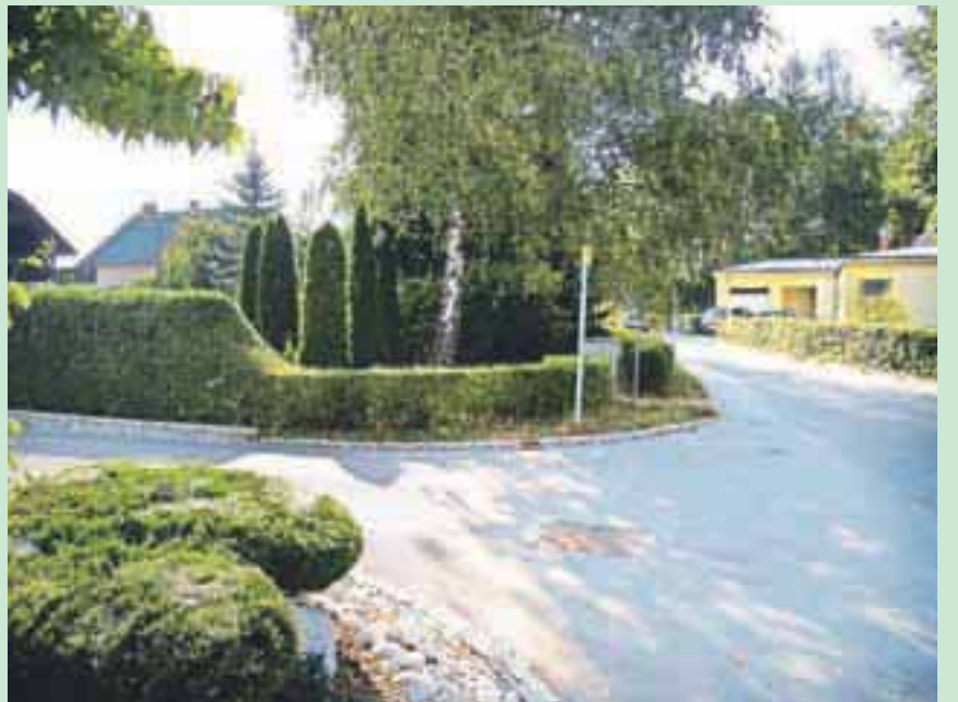
Urejena živa meja (polje preglednosti je ustrezno)

Opozarjamo, da je treba posebno še za vegetacijo skrbeti skozi celo leto in tako zagotavljati minimalno polje preglednosti. Neprimerno vzdrževana vegetacija, ograja ali druga ovira ob občinskih cestah in javnih poteh predstavlja oviro, ki ogroža varnost udeležencev v prometu ter pomeni opustitev naložene dolžnosti po zakonu in odlokih. Zato vse lastnike ob občinskih cestah opozarjamo in pozivamo, da uredijo oziroma redno vzdržujejo vegeta-