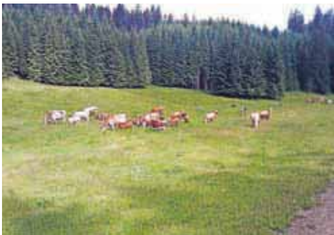
Na planincih / (Foto: iz arhiva AS Lipniška planina)

Sicer pa v Žitovi leški pekarni vsak dan spečejo od sedem do osem ton kruha in pekovskih izdelkov, kar pomeni okrog dvajset tisoč kosov. V popoldansko-nočni izmeni v pekarni dela osemnajst ljudi.